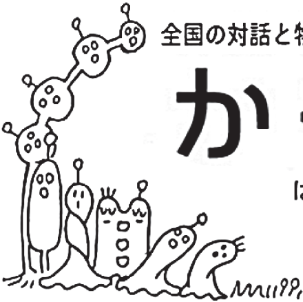
イラストレーション/ナガノハル